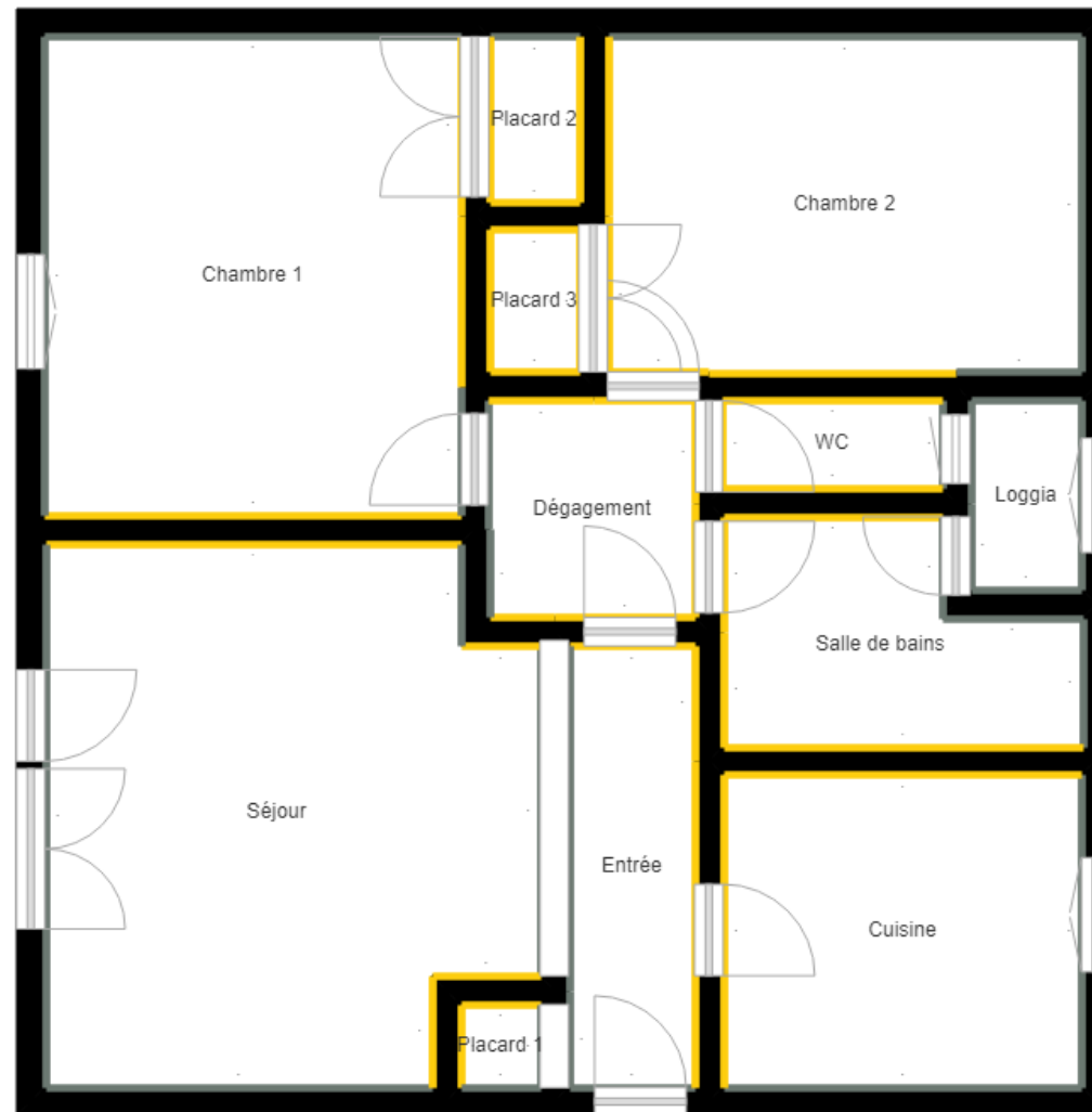
PLANCHE DE REPERAGE

Bien : 16LAP0202 - 2 27 AVENUE DE LA REPUBLIQUE 77400 LAGNY SUR MARNE